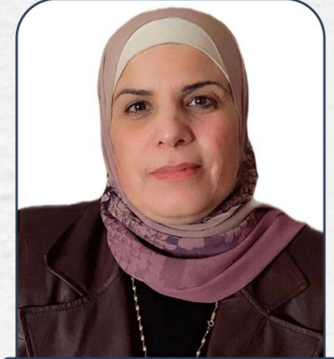
د. سوسن جمال قباجه وزارة التربية والتعليم العالي، فلسطين

تُمنح شهادة حضور للمشاركين الذين يحضرون فعاليات المؤتمر عن بُعد خلال أيام انعقاده